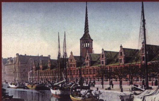
Børsen i København, hvor auktionen afholdes.